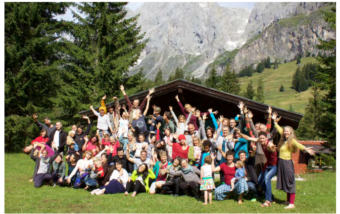
Die Festivalgemeinschaft vor dem majestätischen Hochkönig

Neben einem Tagesprogramm mit fixen Punkten wie Morgen- und Abendkreise, Workshopzeiten, Essenszeiten, Zeit für die Empathiegruppe, haben wir uns jeden Tag mit dem Halten der Kinder befasst und in die Runde gefragt wer bereit ist DA zu sein. Kids Cats nannten wir diese Aufgabe. Es gab kein „extra“ Kinderprogramm, niemanden der einen gratis Platz bekommen hat, um dann die ganze Zeit auf die Kinder aufzupassen. Alles war spontan und aus der Gemeinschaft heraus entstanden. Und es war immer wer DA und etwas LOS. Und wenn zu wenig, dann haben die Kids selbst Bitten gestellt.. Dies alles hat viele von uns bereichert und eingeladen uns wirklich gebraucht zu fühlen. Und es hat von uns allen einiges verlangt in dieser Form die Kids in unserer Mitte zu halten und gleichzeitig auf unsere Bedürfnisse zu achten.