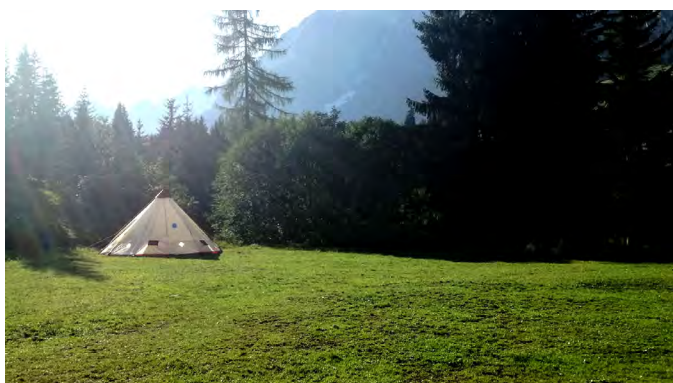
Unsere Seminar-Zelte

Wir vom Organisationsteam stellten dieses Jahr ganz bewusst Natur vor Komfort. Eine mutige Entscheidung die uns auf vielen Ebenen hat wachsen lassen. Da es zu wenige Seminarräume gab, stellten wir zwei große, runde Zelte auf, in denen Workshops abgehalten wurden. Die Kinder hatten ihr eigenes Tippi. Bei schönem Wetter fand alles draußen statt.