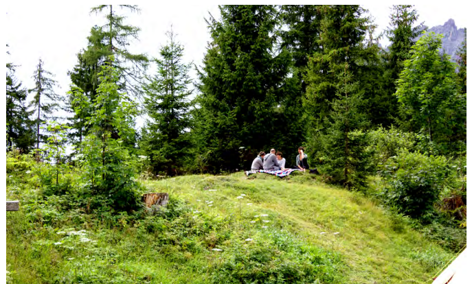
Empathiegruppe - im Grünen

Neben einem Tagesprogramm mit fixen Punkten wie Morgen- und Abendkreise, Workshopzeiten, Essenszeiten, Zeit für die Empathiegruppe, haben wir uns jeden Tag mit dem Halten der Kinder befasst und in die Runde gefragt wer bereit ist DA zu sein. Kids Cats nannten wir diese Aufgabe. Es gab kein „extra“ Kinderprogramm, niemanden der einen gratis Platz bekommen hat, um dann die ganze Zeit auf die Kinder aufzupassen. Alles war spontan und aus der Gemeinschaft heraus entstanden. Und es war immer wer DA und etwas LOS. Und wenn zu wenig, dann haben die Kids selbst Bitten gestellt.. Dies alles hat viele von uns bereichert und eingeladen uns wirklich gebraucht zu fühlen. Und es hat von uns allen einiges verlangt in dieser Form die Kids in unserer Mitte zu halten und gleichzeitig auf unsere Bedürfnisse zu achten.