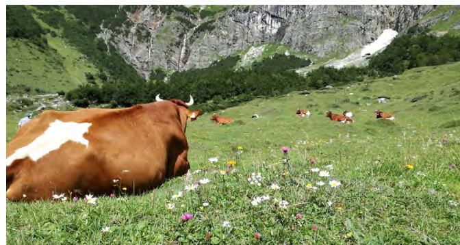
...und noch ein Blick

Mithilfe der Förderung vom Netzwerk Gewaltfrei Austria und einer privaten Spende einer Teilnehmerin konnten wir nicht nur die Zelte finanzieren, sondern auch zahlreiche Menschen, vor allem Frauen mit kleinen Kindern, finanziell fördern und eine Teilnahme erleichtern bzw. überhaupt möglich machen.