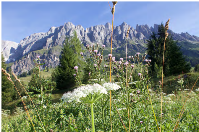
Morgenblick in die Berge

Neben dem Tagesprogramm haben wir in zwei Workshops gemeinsam ein Restoratives System entwickelt, welches für die Festivalzeit wirksam war. Das heißt, eine Gruppe von Menschen hat sich bereit erklärt bei einer Conflict Weave mitzuarbeiten. Es gab eine ganz klare Landkarte was im Konfliktfall zu tun ist. Ich feiere die Weiterentwicklung vom ersten zum zweiten Festival und das lebendige Labor und Feld zum Erforschen der Gewaltfreien Kommunikation